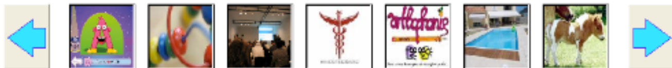
Choix des pictogrammes ou photos accessibles en bas d'écran